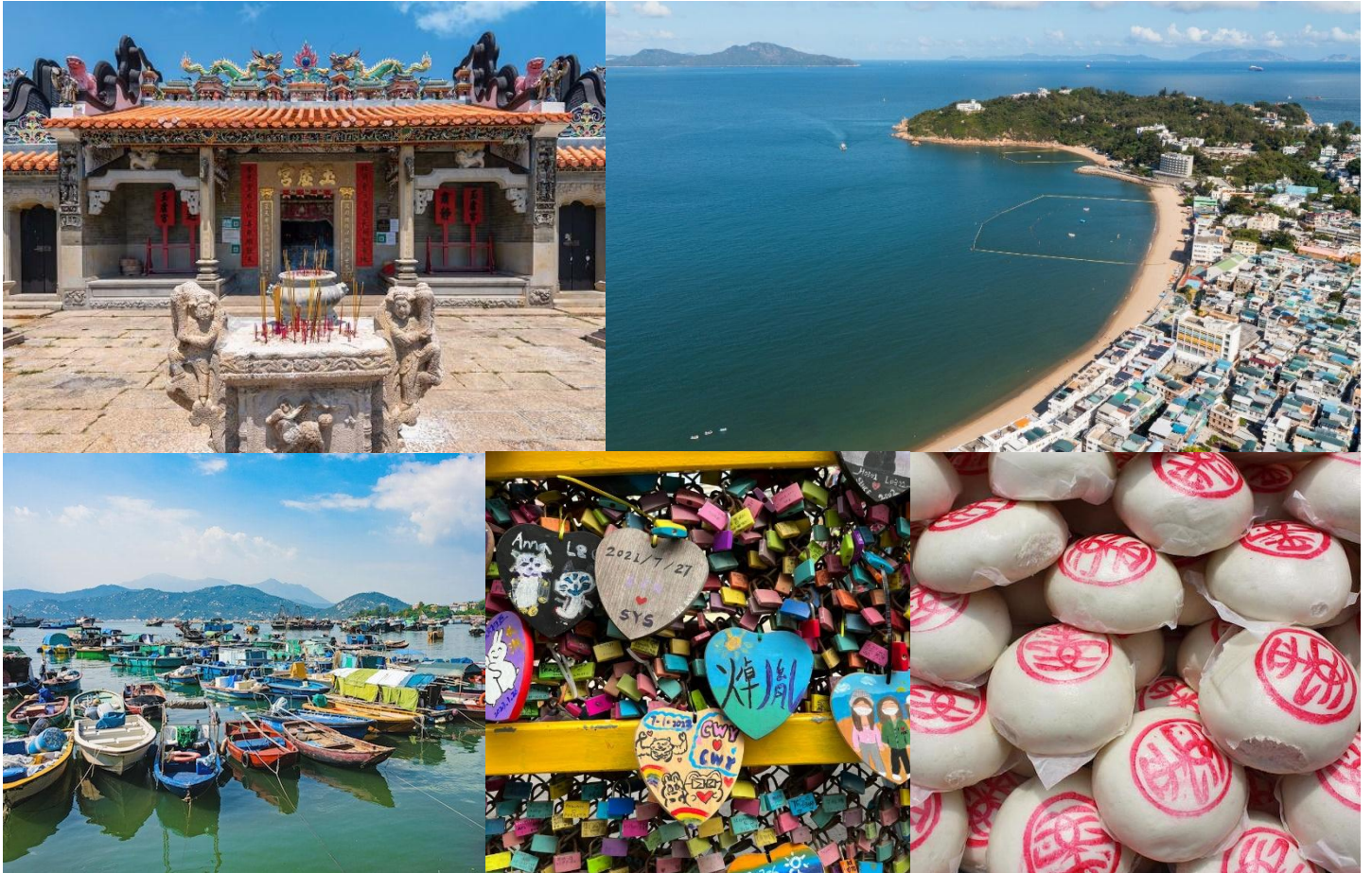
เที่ยง รับประทานอาหาร ณ ภัตตาคาร ***อาหารทะเลสไตล์ฮ่องกง