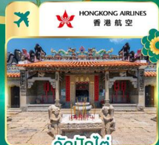
วัดปึกไต้