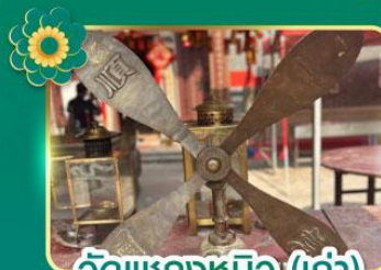
วัดเขกงหมิว (เก่า)