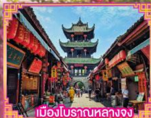
เมืองโบราณหลวงจง