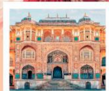
♡♡♡ Amber Fort