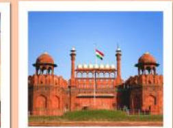
♡♡♡ Agra Fort