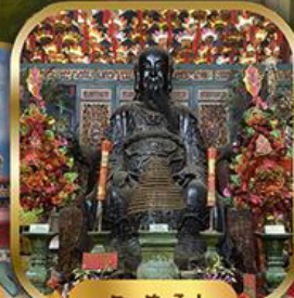
วัดปึกโต