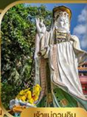
เจ้าแม่กวนอิม ริวลิ้นหยี่