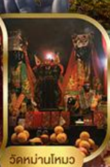
วัดนานโหมว