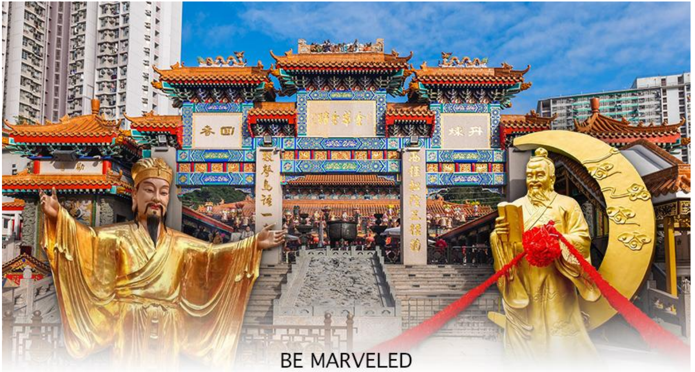
BE MARVELED วัดหวังต้าเซียน

ฮ่องกงบอกว่าถ้าเป็นผู้หญิงอย่างเราอยากได้แฟน ก็ต้องไปผูกค้ายี่รูปร่างผู้ชายและพอไหวเสร็จแล้วก็อย่าลืมหยอดทำบุญใส่ตู้ไปด้วย