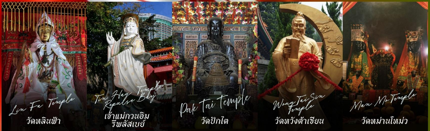
Lin Fa Temple วัดหลินฟ้า

รายการทัวร์ข้างต้นอาจมีการปรับเปลี่ยนเพื่อความเหมาะสม