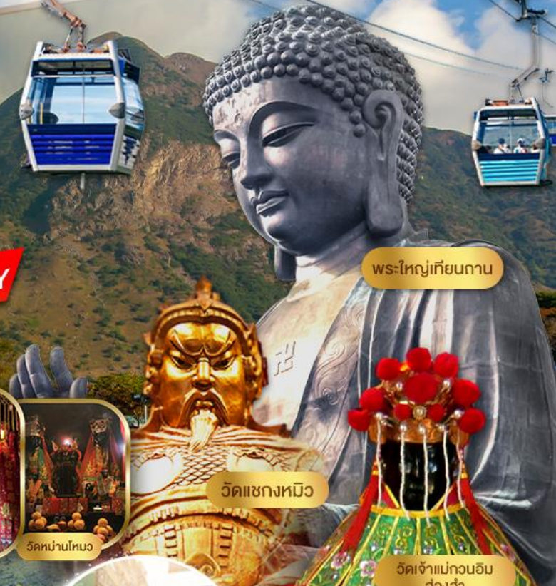
พระใหญ่เทียนถาน