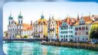
เมืองลูเซิร์น