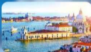
มหานครเวนิส