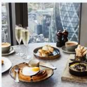
DUCK AND WAFFLE