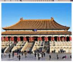
พระราชวังต้องห้ามปักกิ่ง