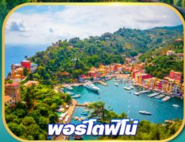
พอร์ตอฟีโน