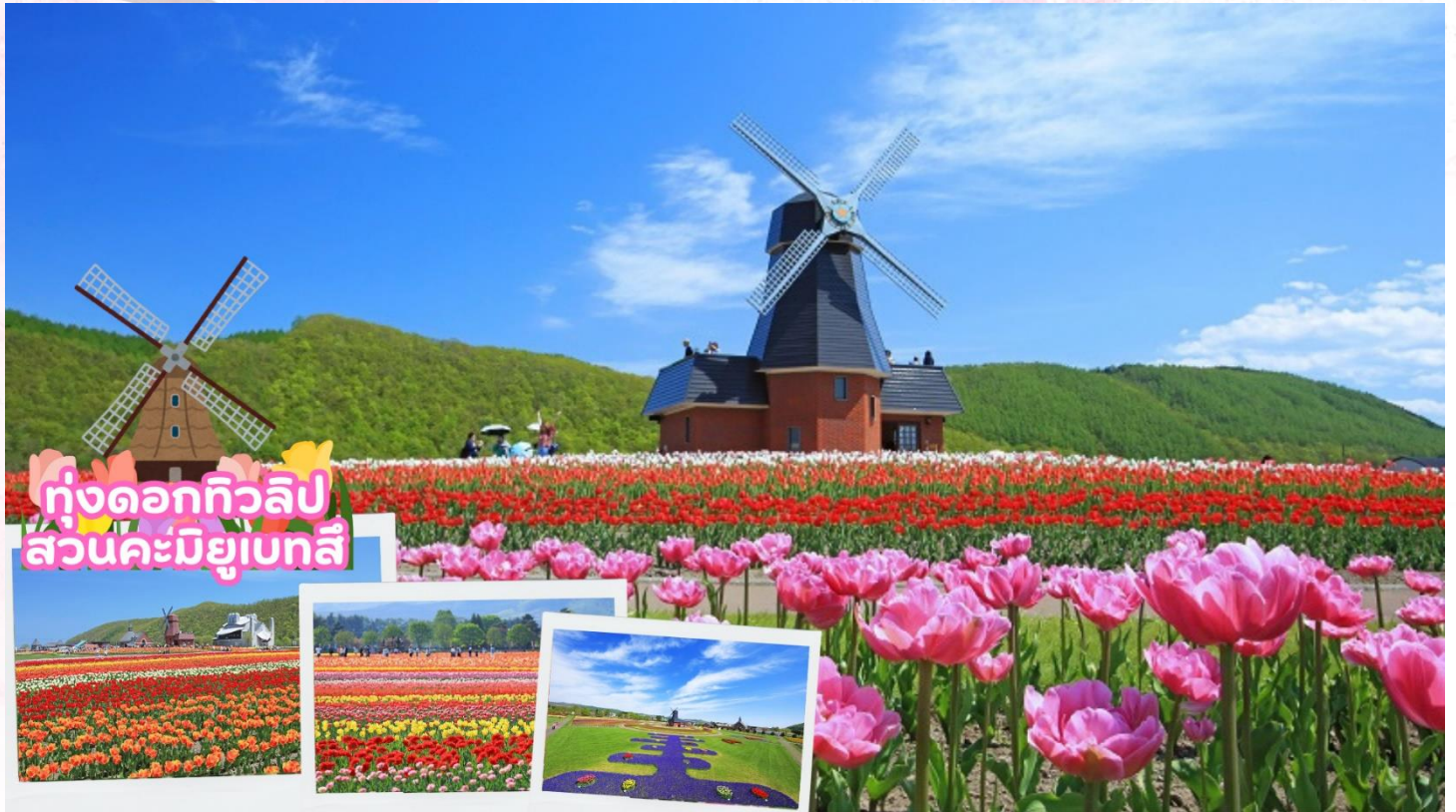
ทุ่งดอกทิวลิป สวนคะมิยูเบทสึ

จากนั้นนำท่านชมทุ่งดอกทิวลิป ณ สวนคะมิยูเบทสึ (Kamiyubetsu Tulip Park) จากสวนดอกไม้เล็ก ๆ ที่ถูกสร้างขึ้นโดยคนท้องถิ่นเพื่อสืบทอดดอกทิวลิป [ดอกไม้ประจำเมือง] ไปสู่รุ่นต่อไป และได้พัฒนา มาเป็นอุทยานทิวลิปคะมิยูเบทสึ ปัจจุบันอุทยานแห่งนี้มีดอกทิวลิปสีแสนสดใส กว่า 1,200,000 ดอก จาก กว่า 120 สายพันธุ์ ที่จะบานทั่วทั้งสวนในฤดูใบไม้ผลิ [ขึ้นอยู่กับสภาพอากาศ]