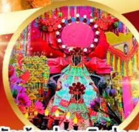
วัดเจ้าแม่กวนอิมฮ้องฮ่า