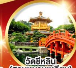
วัดซีหลิน (สวนหนานเหลียน)