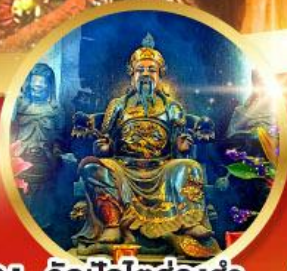
วัดปักไต้ฮ้องฮ่า