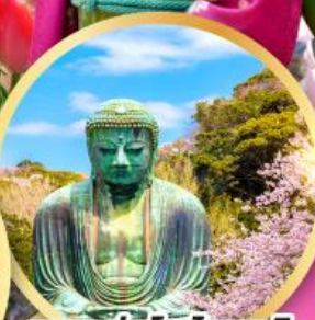
หลวงพ่อดโต โดบุตสึ

ชมเทศกาลดอกทิวลิป ณ สวนชากุระฟูรุโนะซาโตะฮิโระ พักออนเซ็นพร้อมบุฟเฟ่ต์ชาบู 1 คืน