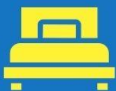
ห้องพักเดี่ยว SINGLE

ตัวอย่างประเภทห้องพัก *เป็นเพียงตัวอย่างเพื่อให้เห็นภาพสำหรับประเภทห้องในแบบต่างๆ