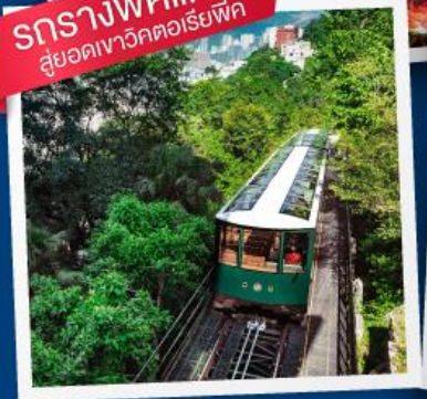
รดรางพืดแทรพ สูยอคเวารวัตตอรัยพืด