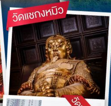
วัดเขกงหนิว