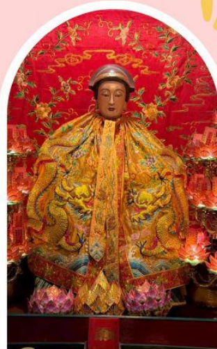
วัดหลงโหมว

ความสำเร็จ ความมั่งคั่ง เงินทองไหลมาเทมา