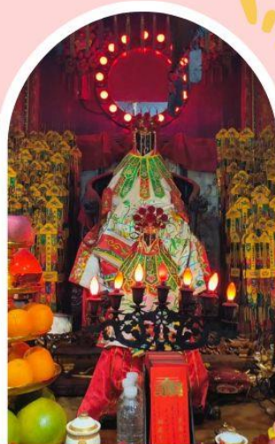
วัดเจ้าแม่กวนอิมฮ่องฮำ

ความสำเร็จ ความมั่งคั่ง เงินทองไหลมาเทมา