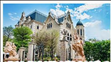
NINA CHOCOLATE CASTLE

ทะเลสาบสุริยจันทราร - ไทเป 101 จิวเฟิน - NINA CHOCOLATE CASTLE MONSTER VILLAGE - ชิเหมินตง เมนูพิเศษ ปลาประธนาธิบดี เขี้ยวหลงเป่า / ชาบูไต้หวัน