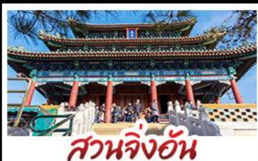
สวนจิ่งอัน