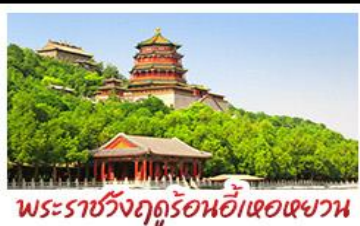
พระราชวังฤดูร้อนอี้ทงหยวน

มือพิเศษ เปิดปากถึง สุกี้มองโก MICHELIN GUIDE ร้าน TAO TAO JU