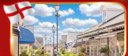
ช้อปปิ้งเอาท์เล็ต Bicester village