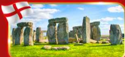
สโตนเฮนจ์ สิ่งมหัศจรรย์ของโลก