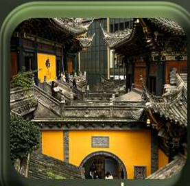
“ วัดหลิวอัน ”