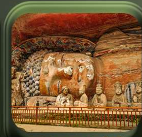
“ ผาหินแกะสลักต้าจู้ ”

T2G-CKG26CZ Special of Chongqing... ซึ่ง อุ้หลง ต้าจู้ อุ้หลง อุทยานหลุมฟ้า เขานางฟ้า 5D 3N (CZ)