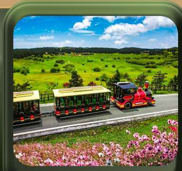
“ อุทยานเขานางฟ้า ”