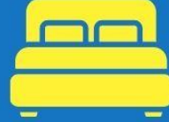
ห้องพักดับเบิล DOUBLE