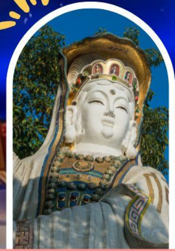
รีพลัสเบย์ รับพลังงานดี เสริมพลังดวงจู้ย