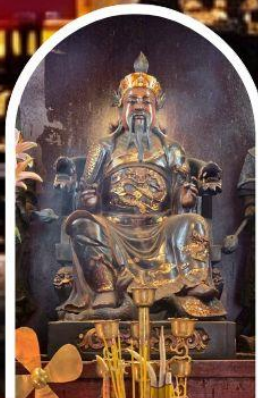
วัดปักไต้ เสริมโชคกลางนำความรุ่งเรืองทุกด้านของชีวิต