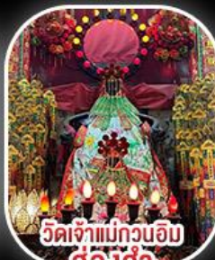
วัดเจ้าแม่กวนอิม ฮองฮ่า