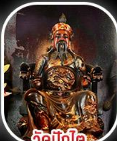
วัดบิกิต