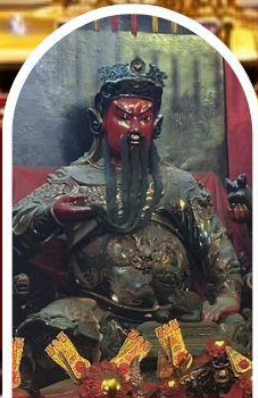
วัดกวนไท่ ขอเทพเจ้ากวนอู ความซื่อสัตย์ เงินทอง ธุรกิจมั่นคง