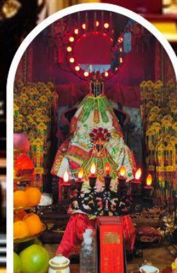
วัดเจ้าแม่กวนอิมอ่องฮำ ขอพรเรื่องเงิน ทรัพย์สิน และความมั่งคั่ง