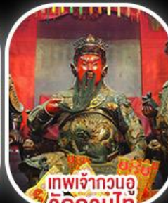
เทพเจ้ากวนอู วัดกวนไท