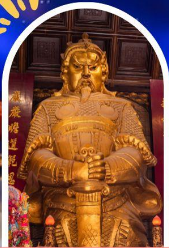
วัดแซกง ขอพรโชคกลาง การเงิน และธุรกิจ