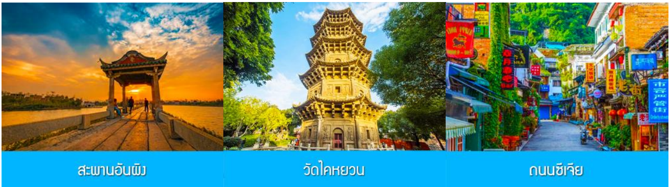
สะพานอันผิง