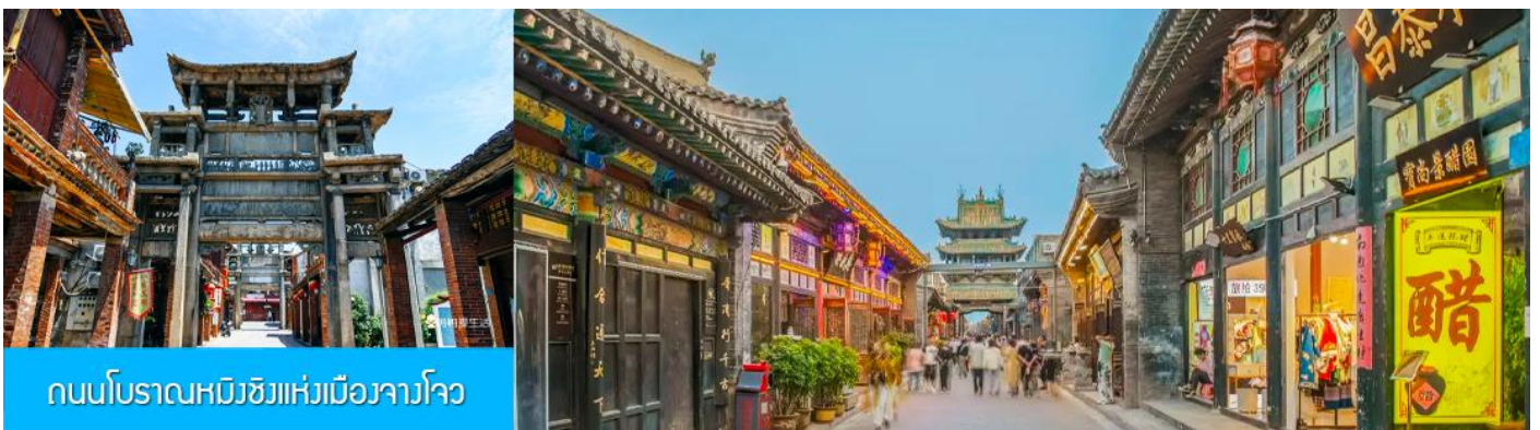
ถนนโบราณหมิงชิงแห่งเมืองจางโจว