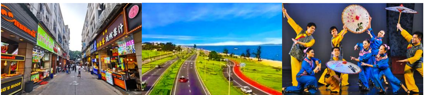
ถนนวซาลู่

พักที่ โรงแรม XIAMEN HENGLONG HOTEL 4* หรือเทียบเท่าในเมืองเซี่ยะเหมิน