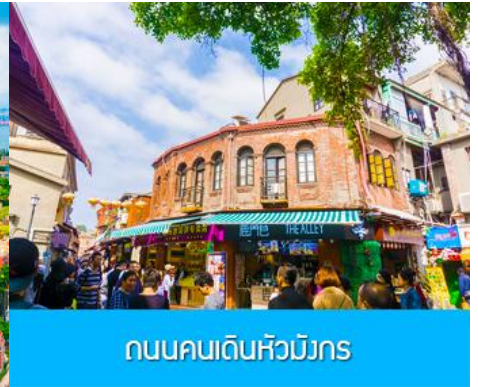
ถนนคนเดินหัวมังกร