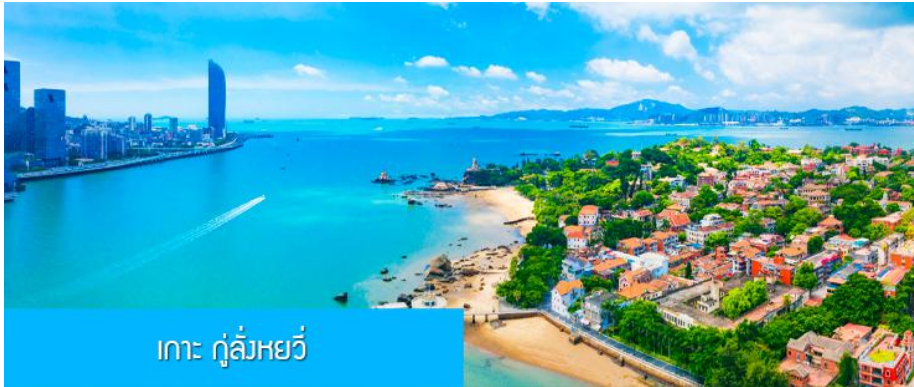
เกาะ กู่ล้งหยวี