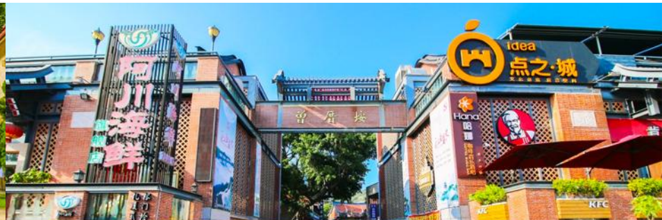
หมู่บ้านชาวประมง เจิงจ้าวอัน