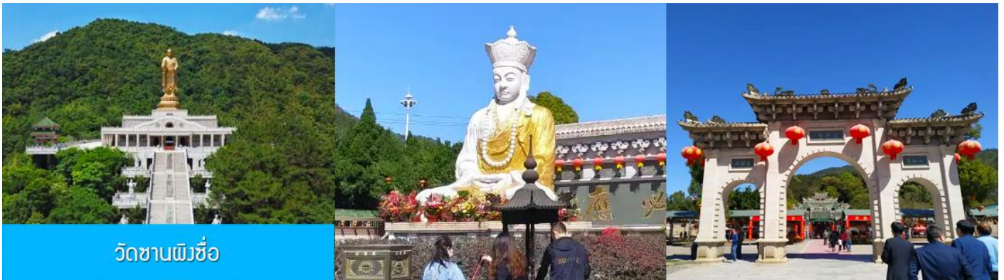
วัดซานผิงซื่อ

หลังอาหารนำท่านเดินทางโดยรถบัสสู่ เมืองจางโจว 漳州 (ระยะทาง 159 กม.ใช้เวลาเดินทางราว 2 ชั่วโมงเศษ)