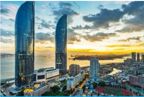
นครเซี่ยเหมิน