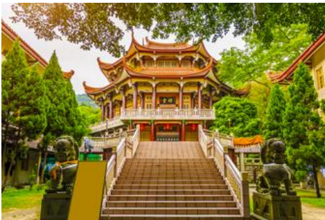
วัดหนานถ้าวชื่อ

ค่ำ รับประทานอาหารค่ำ ณ ภัตตาคาร (1) พักที่ โรงแรม XIAMEN HENGLONG HOTEL 4* หรือเทียบเท่าในเมืองเซี่ยเหมิน