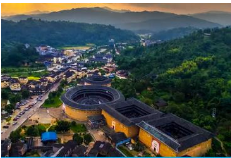
บ้านดินโบราณฉีโหลวกาเป่ย์

พักที่ โรงแรม HAKKA EARTH BUILDING PRINCE HOTEL 4* หรือเทียบเท่าในเมืองหย่งคิง