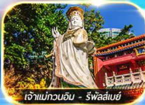
เจ้าแม่กวนอิม - รัฟส์เบย์