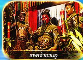
เทพเจ้าอวตู่