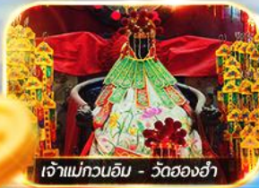
เจ้าแม่กวนอิม - วัดอองฮ่า