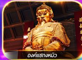
องค์แห่งงิ้ว