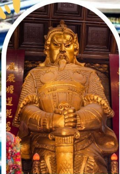
วัดแซกง ขอพรโชคลาก การเงิน และธุรกิจ