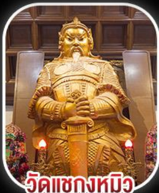
วัดเขกงหนิว

สวนสนุก CHIMELONG SPACESHIP PARK เจ้าแม่กวนอิมรีพลีสาย - เจ้าแม่กวนอิมฮ่องฮำ วัดเขกงหนิว - พระใหญ่องปิง+กระเช้า เมนูสุดพิเศษ!! เป้าอ้อ+ไวน์แดง , ห่านย่าง