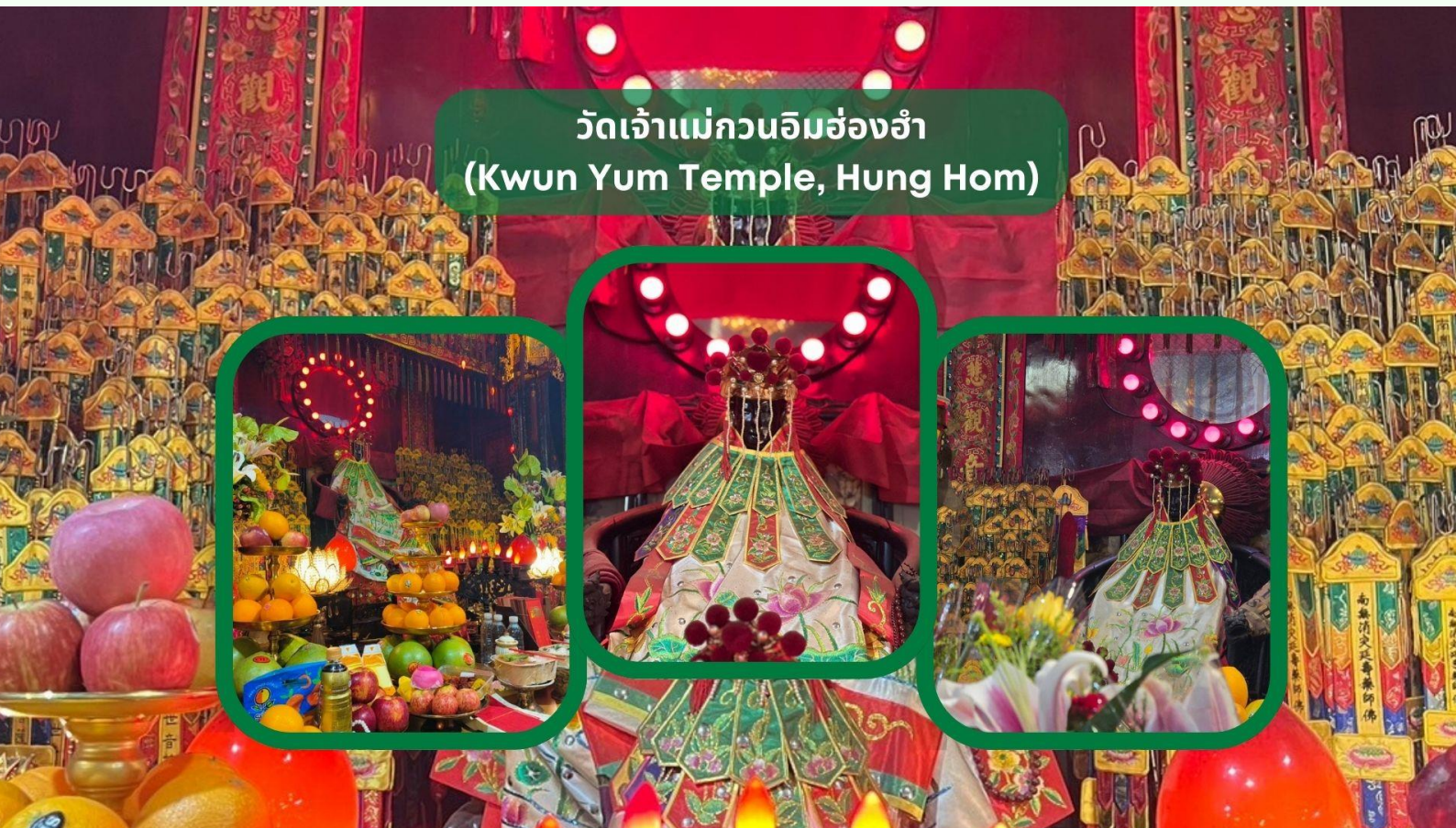
วัดเจ้าแม่กวนอิมฮ่องกง (Kwun Yum Temple, Hung Hom)

หมายเหตุ: ในการเดินทางข้ามด่านระหว่างแต่ละเมือง ท่านจำเป็นต้องลากสัมภาระด้วยตนเอง และผ่านพิธีการตรวจคนเข้าเมืองตามขั้นตอน ซึ่งใช้ระยะเวลาในการเดินและดำเนินการโดยประมาณ 45-60 นาที