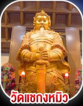
วัดเขกหมิว