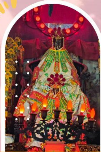
วัดเจ้าแม่กวนอิมฮ่องกง ขอพรเรื่องเงิน ทรัพย์สิน และความมั่งคั่ง