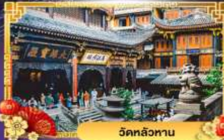
วัดหลัวหนาน