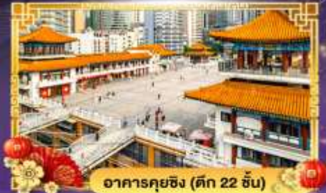
อาคารคุยซิง (ตึก 22 ชั้น)