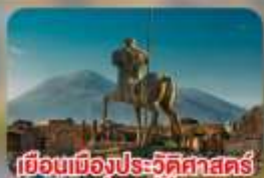
เยือนเมืองประวัติศาสตร์ ปอมเปอี