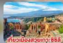
เที่ยวเมืองสวยเกาะซิซิลี Taormina