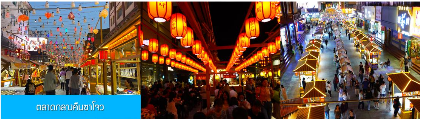
ตลาดกลางคืนซาโจว