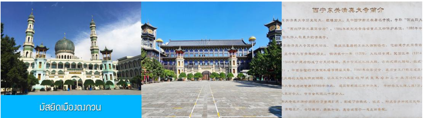
มัสยิดเมืองตงกวน

เช้า บริการอาหารเช้า ณ ร้านอาหารในโรงแรม (17)