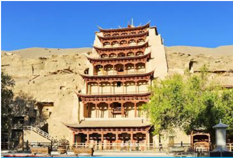
ถ้ำหินมั่วเกาถู

เช้า รับประทานอาหารเช้า ณ ห้องอาหารของโรงแรม (9)