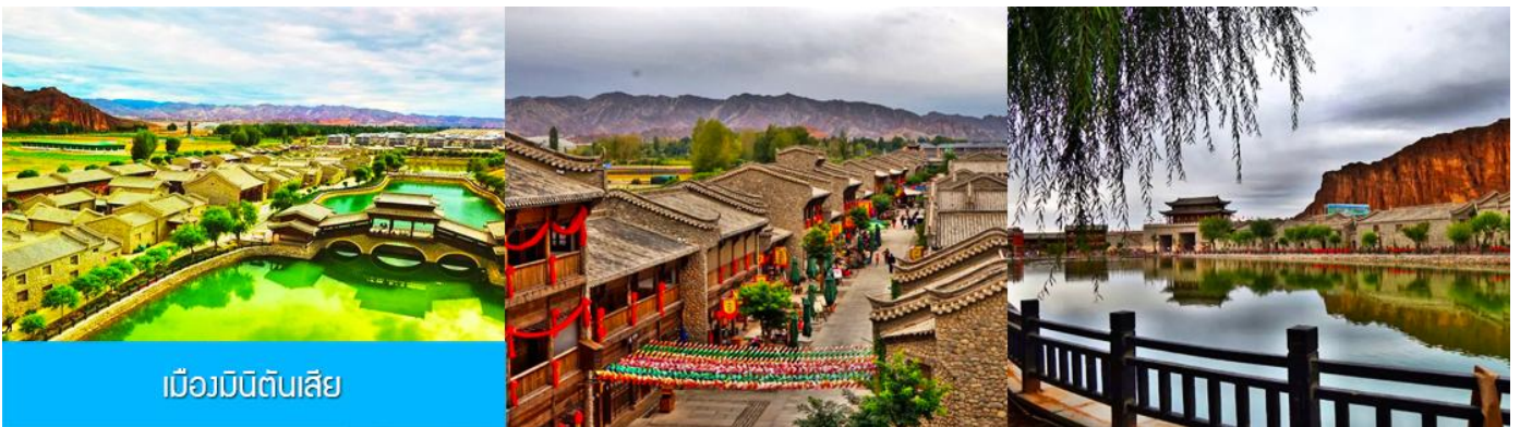
เมืองมรดกดินสี