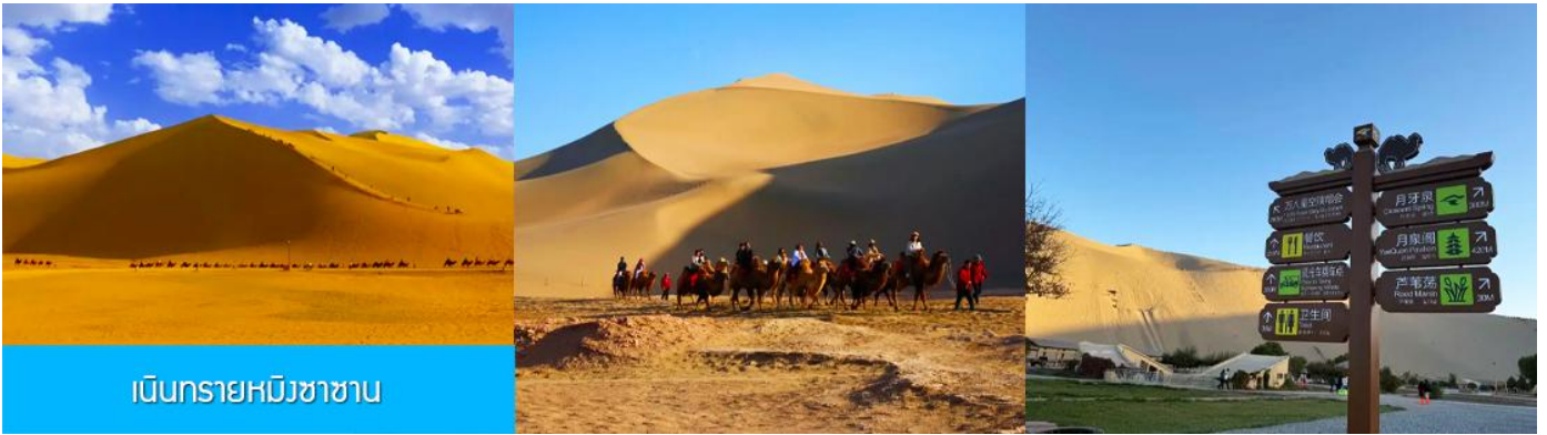
เนินทรายหมิงซาซาน