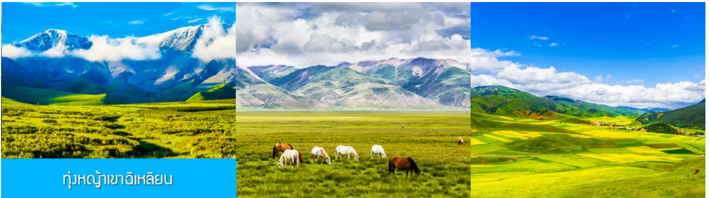
ทุ่งหญ้าเขาอีเหลียน

จากนั้นนำท่านเดินทางโดยรถบัสสู่ทุ่งหญ้าอีเหลียน (ระยะทาง 140 กม. ใช้เวลาเดินทางประมาณ 2 ชั่วโมง)