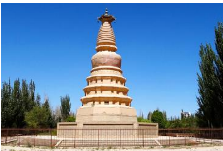
เจดีย์ม้าขาว

เที่ยง รับประทานอาหารกลางวัน ณ ภัตตาคาร (10)