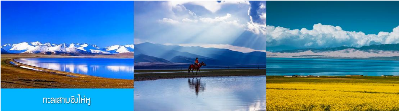
ทะเลสาบชิงไห่หู

หลังอาหารนำท่านเที่ยวชม ทะเลสาบเกลือฉาปา 茶卡盐湖 (รวมนั่งรถไฟชมวิว และดูวงจรบรอนท์ทำลุยน้ำ) ชมทะเลสาบเกลือที่มีสมญานามว่าเป็นกระจกแห่งท้องฟ้าบานใหญ่ ตั้งอยู่ในตำบลฉาปาในอำเภอหูลันของ มณฑลชิงไห่ ผิวทะเลสาบครอบคลุมเนื้อที่ 105 ตารางกิโลเมตร เป็นทะเลสาบเกลือบนที่ราบสูงเหนือ ระดับน้ำทะเล 3,059 เมตร ได้ผิวน้ำจะมีแผ่นหินเกลือที่มีความหนากว่า 10 เมตร มีปฏิมากรรมที่ทำจากเมล็ดเกลือ อาทิ รูปปั้นของเจิ้งกิสข่าน รูปปั้นคาราวานขนเกลือโบราณ ฯลฯ เป็นแหล่งท่องเที่ยวระดับ 4A ที่ได้รับความนิยมจากนักท่องเที่ยวอย่างมากในปัจจุบัน..... นำท่านเดินทางสู่ ทะเลสาบชิงไห่หู (ระยะทาง 150 กม.ใช้เวลาเดินทางราว 2 ชั่วโมงเศษ)