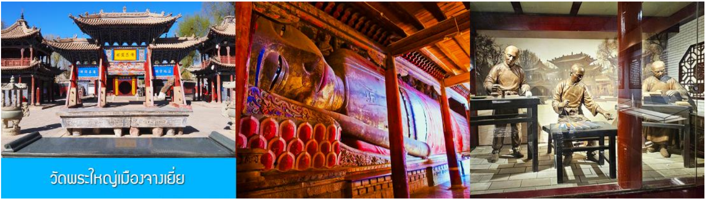
วัดพระใหญ่เมืองจางเยี่ย