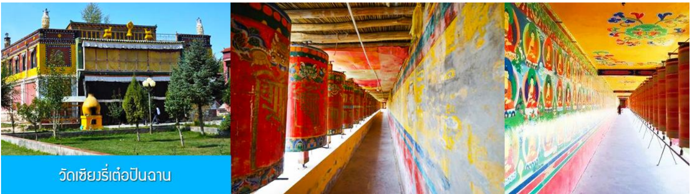
วัดเซียงรีเต๋อปิ่นฉาน