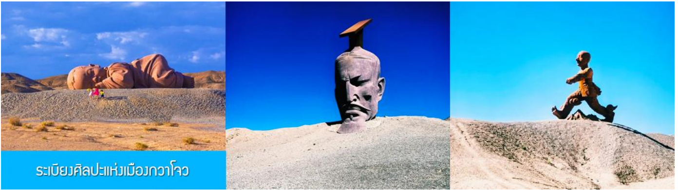
ระเบียบศิลปะแห่งเมืองกวาโจว