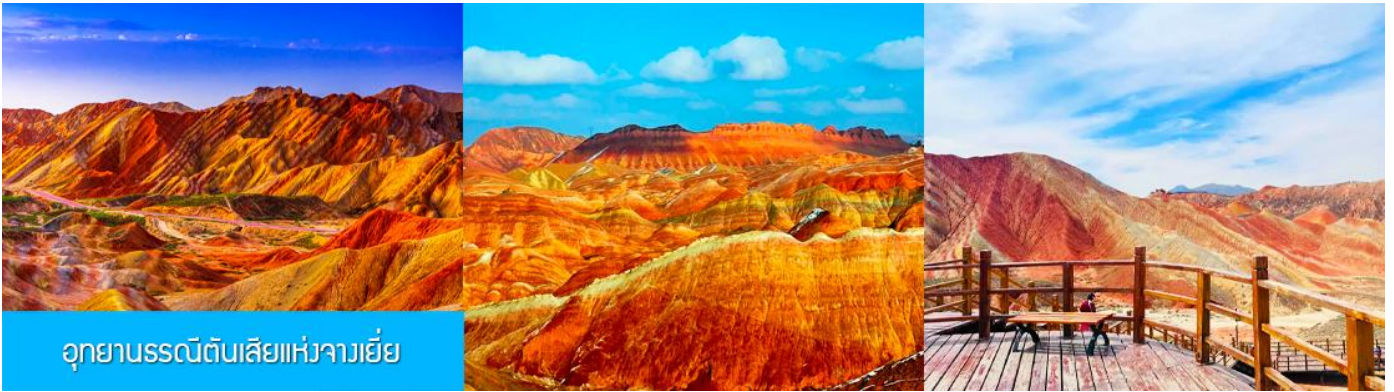
อุทยานธรณีดินสีแห่งจางเยี่ย