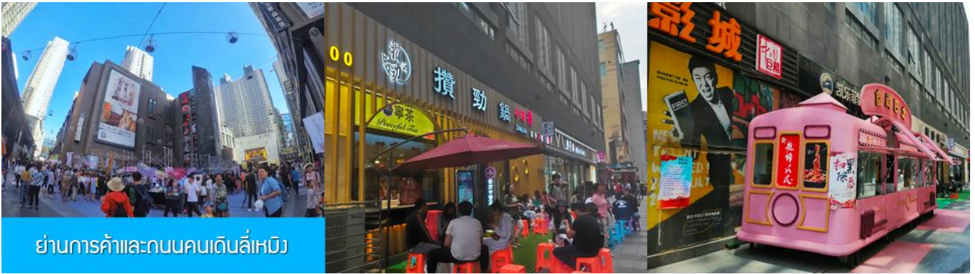
ย่านการค้าและถนนคนเดินลี่เหมิง

หลังอาหารนำท่านสู่ ย่านการค้าและถนนคนเดินลี่เหมิง 力盟商业步行街 ย่านการค้าทันสมัยที่มีห้างสรรพสินค้าขนาดใหญ่หลายแห่ง ถนนคนเดินที่คึกคักไปด้วยร้านค้าแบรนด์ท้องถิ่น ร้านอาหารพื้นเมือง ร้านสะดวกทานฟาสต์ฟู้ด ให้เวลาอิสระท่านเดินช้อปปิ้ง ชิมอาหารพื้นเมืองเต็มที่