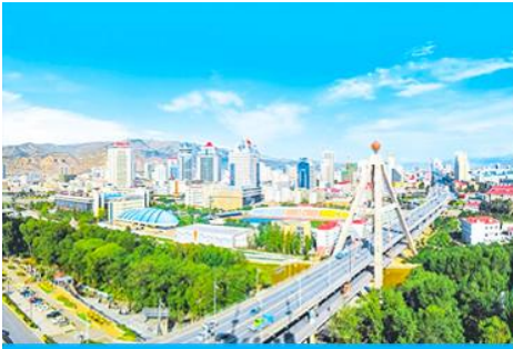
เมืองซีหนิง