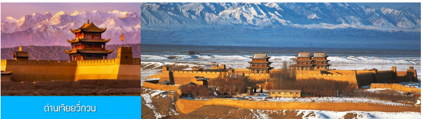
ด่านเจียยวี่กวน

รับประทานอาหารเช้า ณ ห้องอาหารของโรงแรม (12)