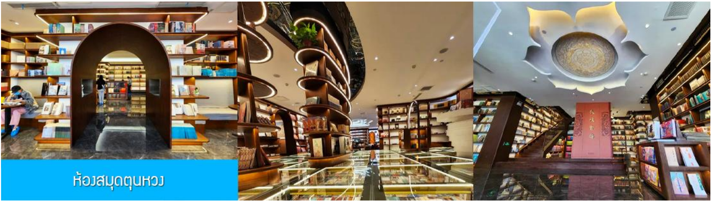
ห้องสมุดตุนหวง