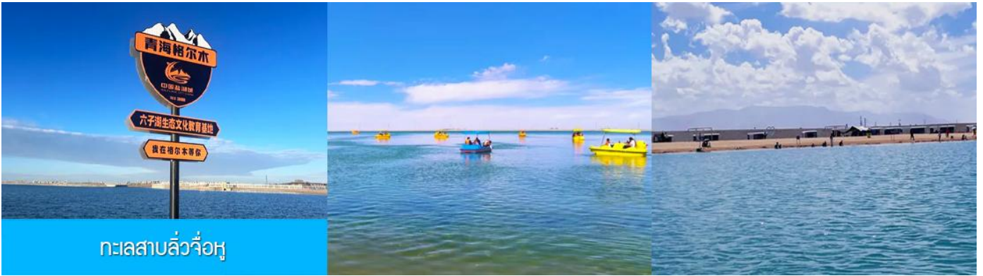
ทะเลสาบลั่วจื่อหู