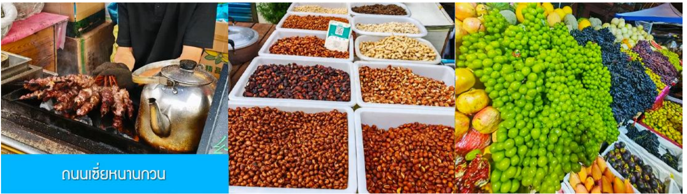
ถนนเซี่ยหนานกวน