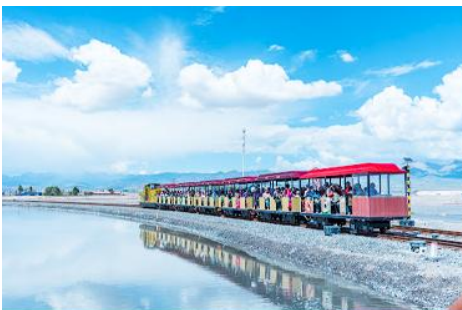
ทะเลสาบเกลือฉาซ่า