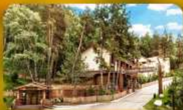
Oi-Qaragai Mountain Resort