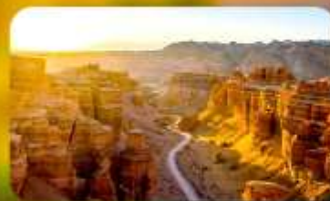
Charyn Canyon+Black Canyon