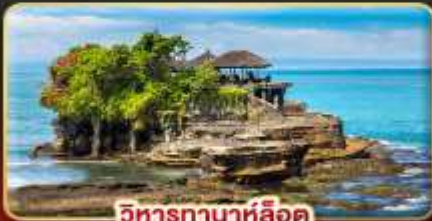
วิหารกานาห์ลือค

สัมผัสมนต์เสน่ห์ธรรมชาติ วัฒนธรรม และจิตวิญญาณแห่งเกาะสวรรค์