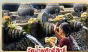
วน้ำพุกสิริคสิริ