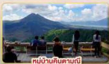
หมู่บ้านคินตามณี