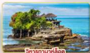
วิหารกานาห์ลอค