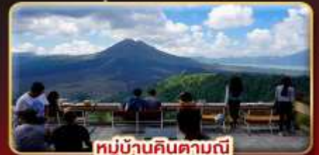
หมู่บ้านคินตามณี