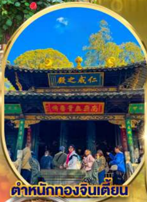
ตำหนักทองจินเตียน