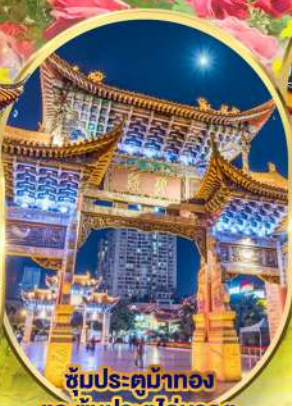
ซุ้มประตูม้าทอง และ ซุ้มประตูโก๋มรกต