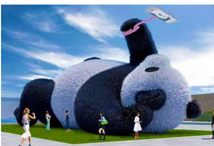
ตุ๊กตาแพนด้าเชลฟี

ระหว่างเดินทางท่านสามารถชมทัศนียภาพธรรมชาติอันงดงามของสองข้างถนนขณะที่รถแล่นผ่าน ที่มีทั้งภูเขาหิมะสูง หุบเขา ธารน้ำ และทุ่งหญ้าบนที่ราบสูง หรือพักผ่อนตามอัธยาศัยบนรถระหว่างเดินทาง