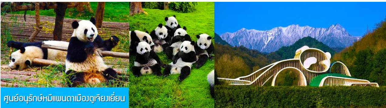
ศูนย์อนุรักษ์หมีแพนด้าเมืองตูเจียงเขียน