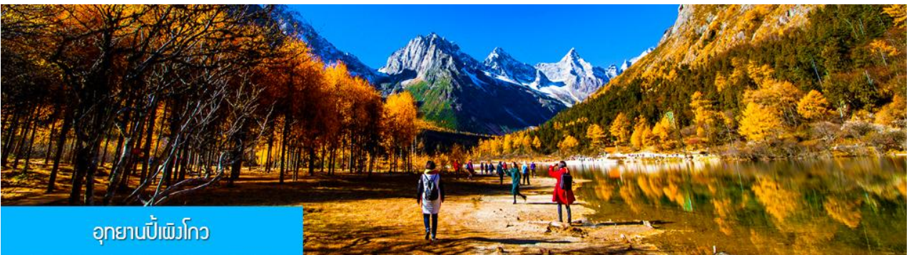
อุทยานเป่ย์เฟิงโกว