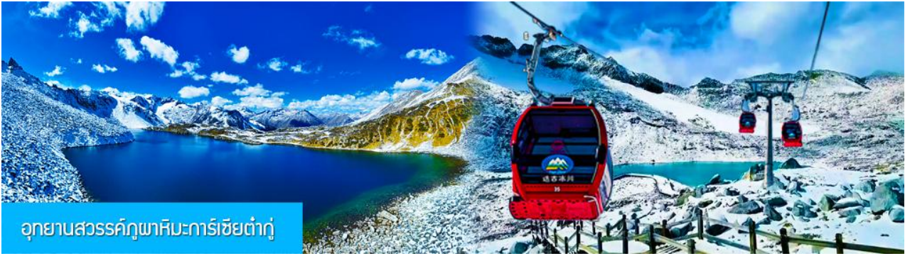
อุทยานสวรรค์ภูผาหิมะการ์เซียต้ากู่