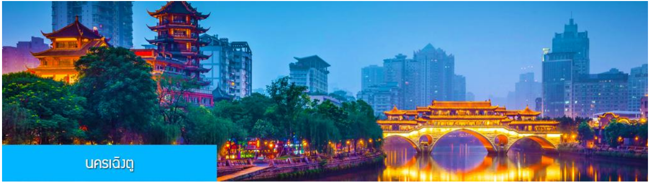
นครเฉิงตู