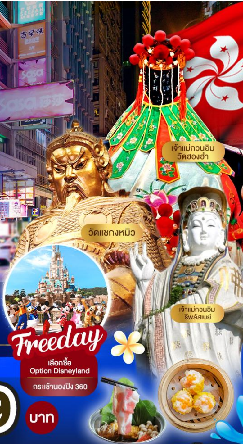
เจ้าแม่กวนอิม วัดสอง丫