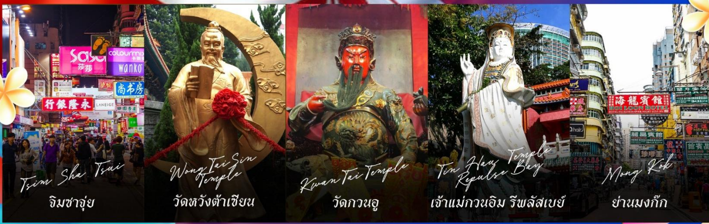
Tsim Sha Tsui จิมซาจุ่ย

รายการทัวร์ข้างต้นอาจมีการปรับเปลี่ยนเพื่อความเหมาะสม