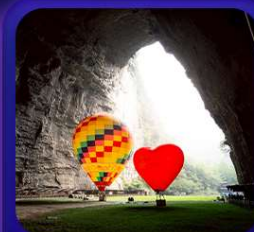
“ ถ้าถึงหลง ”