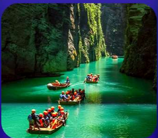
“ ผิงซานแกรนด์แคนยอน ”

เที่ยวจีน 2 มณฑล เสฉวน+หูเป่ย์ • ถ้าถึงหลง • หุบเขาสิงโต ซื่อจื่อกวน ล่องเรือมังกรกั๋งสู่ผิงซานแกรนด์แคนยอน (รวมล่องเรือ) หงหยาดัง • จุดชมรถไฟฟ้าทะลุทิว • ตึกตะเกียบ • สือปาตี • หลงเหมินฮ่าว