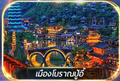
เมืองโบราณปู้จี้

สัมผัสบรรยากาศสุดโรแมนติก ณ หมู่บ้านปู้จี้ & ป่าภูเขาหมื่นยอด เดินเล่น Wenlin Street ชมต้นแปะก๊วย & ถนนสายคาเฟ่สุดฮิต