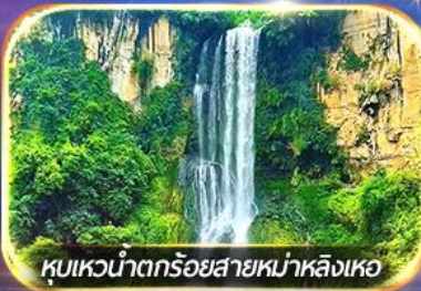
หุบเขาน้ำตกร้อยสายหม่าหลิงเหอ