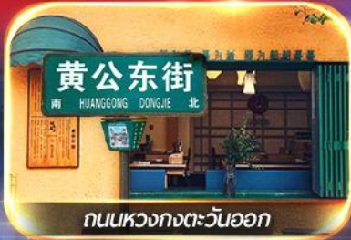
ถนนหวงกงตะวันออก