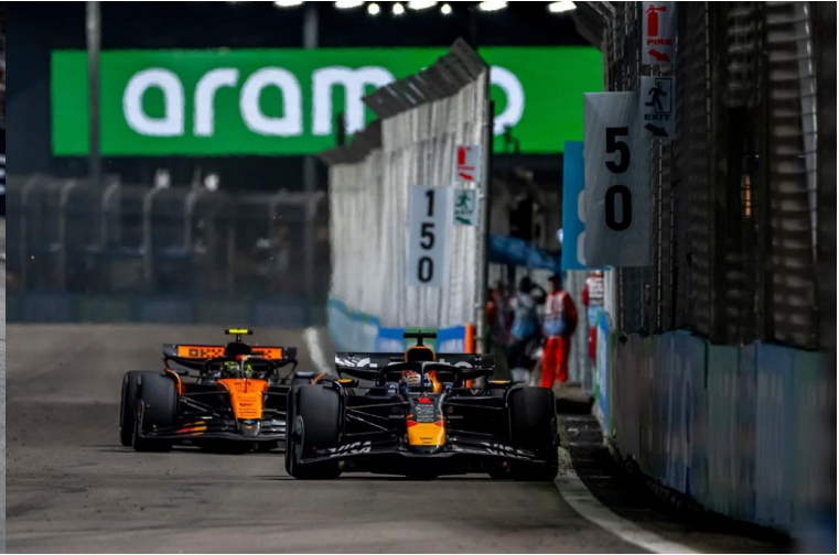
ชม รอบ SPRINT RACE + QUALIFYING