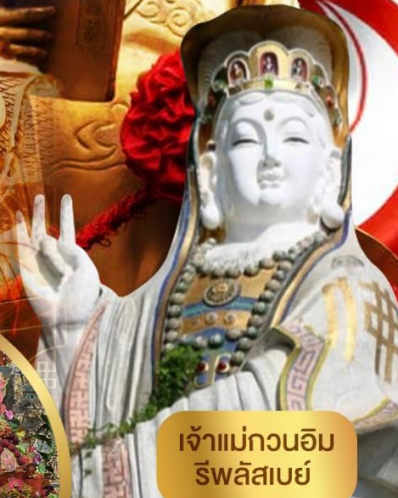
เจ้าแม่กวนอิม ริพลีสเบย์