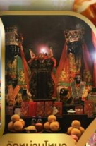
วัดบ้านใหม่