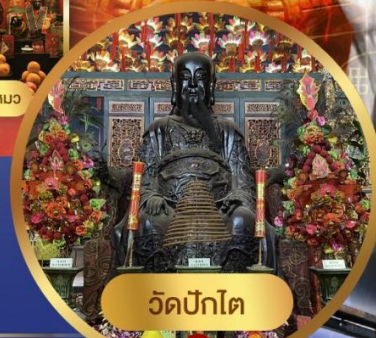
วัดปึกโต