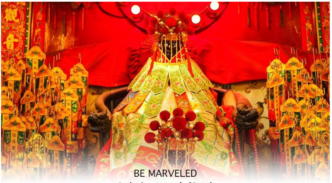
วัดเจ้าแม่กวนอิมสองอำ (ยิมวิน)

หลังจากนั้น นำทุกท่านเดินทางไปยัง (เจ้าแม่กวนอิม วัดสองอำ (HUNG HOM KWUN YUM TEMPLE) เป็นหนึ่งในวัดที่เก่าแก่ที่สุดของฮ่องกง และชาวฮ่องกงเลื่อมใสศรัทธามาก สร้างขึ้นในปี ค.ศ.1873 ในสมัยช่วงสงครามโลกครั้งที่ 2 มีการปล่อยระเบิดลงบริเวณใกล้เคียงกับวัดแห่งนี้หลายต่อหลายครั้ง ทำให้มีผู้บาดเจ็บและล้มตายมากมาย แต่ชาวบ้านที่หนีเข้าไปหลบภัยในวัดนี้กลับปลอดภัยอย่างปาฏิหาริย์ และตัววัดก็ไม่ได้ได้รับความเสียหายจากเหตุการณ์ทิ้งระเบิดที่น่าอัศจรรย์ ตามความเชื่อของคนจีนในฮ่องกง-มาเก๊า จะมี "วันเปิดทรัพย์" หรือ "พิธียืมเงิน เจ้าแม่กวนอิมฮ่องกง" เป็นวันที่จะมาขอพรและยืมเงินเจ้าแม่กวนอิมซึ่งนับจากหลังวันตรุษจีน ไป 26 วัน จะเป็นวันเปิดทรัพย์ที่จัดขึ้นในทุกๆปี พิธีนี้จะมีเพียงครั้งปีละครั้งเท่านั้น เป็นวันสำคัญอีกวันที่คนหลังไหลมาไหว้ขอพรอย่างไม่ขาดสาย