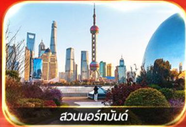
สวนนอร์มันด์