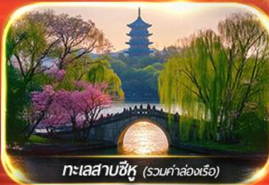
ทะเลสาบซีหู (รวมค่าล่องเรือ)