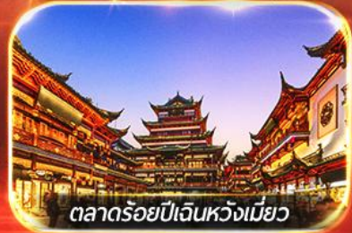
ตลาดร้อยปีเงินหวังเมี่ยว

เช็คอินหาดไว่ทาน ถ่ายรูปมุมฮิต หอไข่มุก + ตึกยุโรป (เดอะบันด์) บอพรแก่ชงวัดพระหยกขาว ซุปบึงจู่ใจ ถนนนานกิง, ตลาดใต้รุ่งอุ๋หลิน