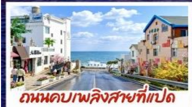
ถนนคอปเปิลิงสาขาที่แปด