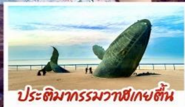
ประติมากรรมวาฬยักษ์ตื่น