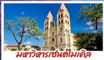
มหาวิหารเซนต์โมเกิล