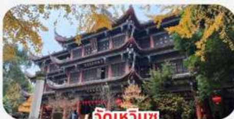
วัดเหวินชู่