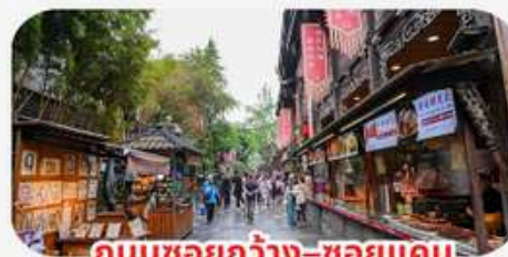
ถนนชอยกว้าง-ชอยแคบ