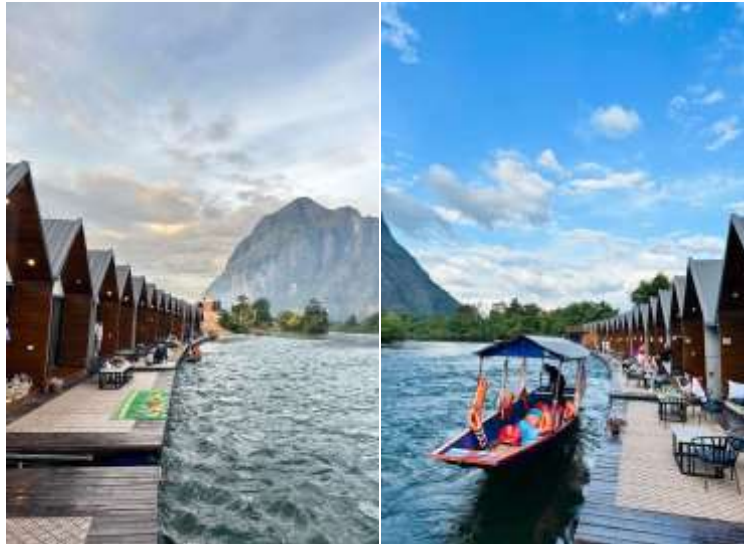
แพที่พัก 2 หรือเทียบเท่า

อิสระให้ท่านพักผ่อนชมธรรมชาติตามอัธยาศัย