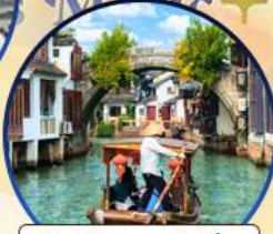
เมืองโบราณจูเจียเจีย