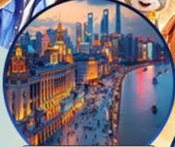
หาดไวทาน