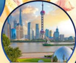
นอร์ทปิ่น กรีนแลนด์