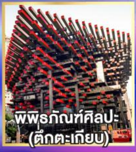
พิพิธภัณฑ์ศิลปะ (ตึกตะเกียบ)