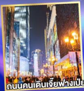
ถนนคนเดินเจียฟางเป่ย์