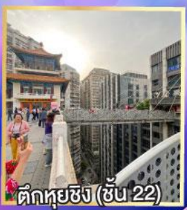
ตึกหุยซิง (ชั้น 22)