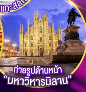
ถ่ายรูปด้านหน้า "มหาวิหารมิลาน"