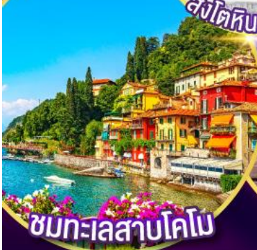
ชมทะเลสาบโคโม