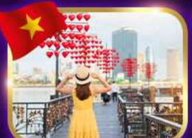
เช็คอินสะพานแห่งความรัก