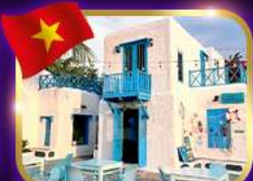
คาเฟ่สุดชิค ซานทรา มาริน่า