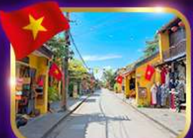
เมืองเก่ามรดกโลก ฮอยอัน