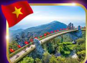
สะพานมือสีทอง บานาฮิลล์