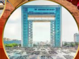
ประตูแห่งความสุข