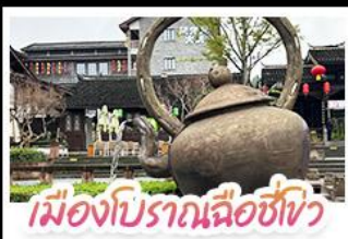
เมืองโบราณฉือชิว