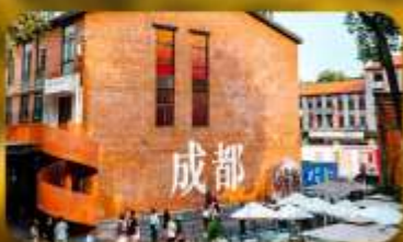
ตงเจียวจี้