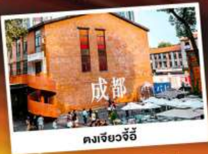
ตงเจียวจี้

เทือกเขาแอลป์แห่งเมืองจีน ชมความงามของ "อุทยานภูเขาเสีครณี"