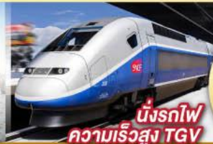
นั่งรถไฟ ความเร็วสูง TGV