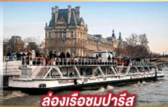
ล่องเรือชมปารีส