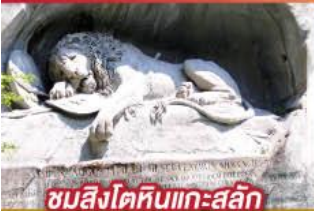
ชมสิงโตหินแกะสลัก