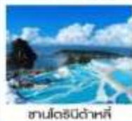
ซานโตรินี่ด้าหลี่