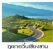
กุเซาอวั้นเซียงซาน