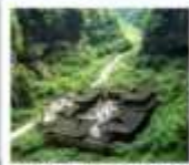
หุบเขาผิงผิงสวรรค์